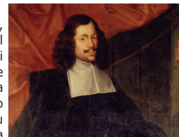
(Giovanni Antonio di Eggenberg)

Con il passaggio di mano agli Asburgo, che la conquistarono nel settembre del 1511, Gradisca fu interessata da molti cambiamenti, ma la sua funzione strategico-militare, ormai rivolta a salvaguardia del confine con lo Stato veneto, rimase invariata, anzi, fu addirittura potenziata. Inizialmente, la rocca situata sulla sommità del Collisello, vicino al fiume, già sede del comando militare e dell'arsenale veneto, fu fortificata con una robusta cinta, che contribuì ad isolare il complesso di opere dal resto della cittadella. Successivamente, la ex-rocca veneta lasciò il posto al Palazzo del Capitano, una costruzione massiccia, caratterizzata da quattro torri angolari e destinata ad ospitare il comando militare, mentre, addossato al lato meridionale, fu edificato l'arsenale.